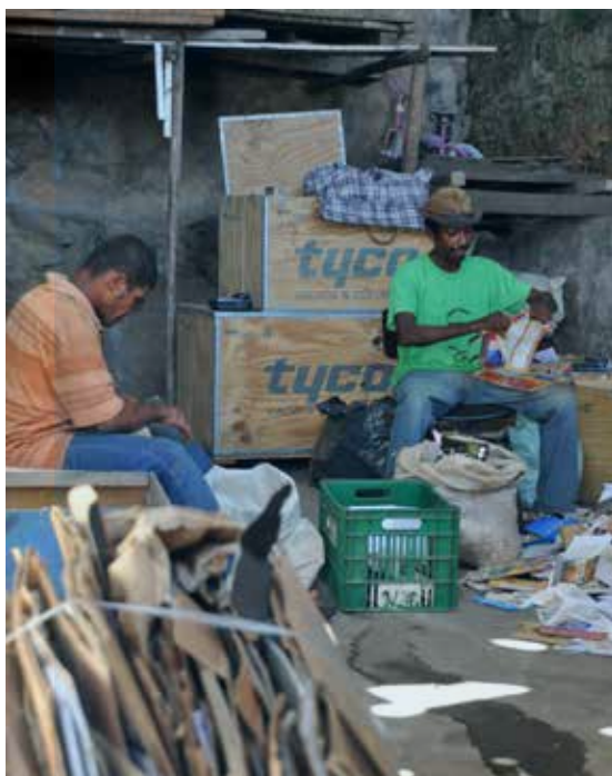
70,9% de las personas en situación de calle entrevistadas ejercen alguna actividad remunerada.

de levantar datos socioeconómicos de los entrevistados. Incluyendo los resultados de los conteos realizados en las cuatro capitales, que no participaron de la pesquisa del MDS, totalizando 45.837 personas en situación de calle 7 .