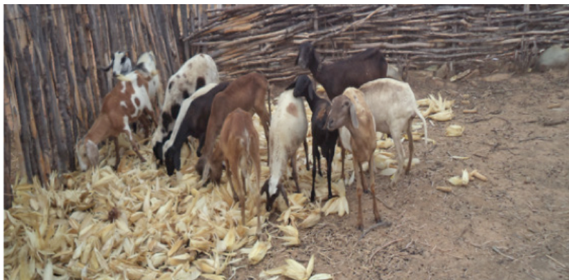
Cabras de Maria Iranete.

La grande capacité de réponse des familles aux investissements est due, en grande partie, à leur contexte de limitations structurelles et à leur expérience ajoutée afin d'avoir affaire aux contingences climatiques et productives. Les Ater mettent en valeur et potentialisent les traditions productives et la rationalité économique des familles bénéficiées tel que le MDSA et le SEAD les a considérées, lors de la définition des conditions pour l'articulation des politiques publiques et pour la faisabilité des objectifs prioritaires de cette politique spécifique 6 .